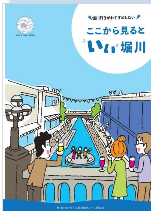
魅せ研で作成した冊子 「堀川好きがおすすめしたい ここから見るといい堀川」