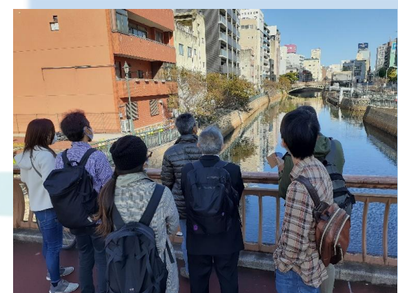
魅せ研まちあるきの様子