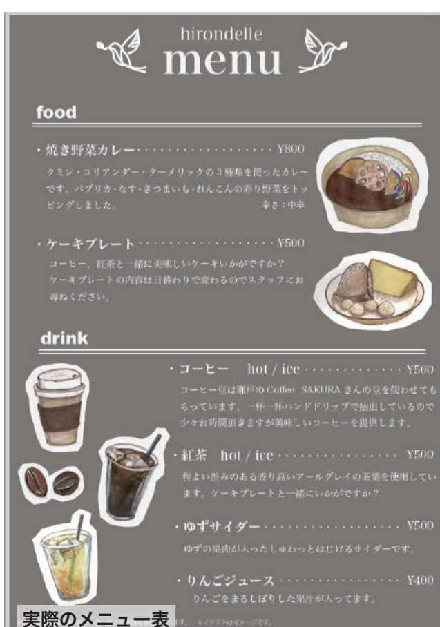
実際のメニュー表