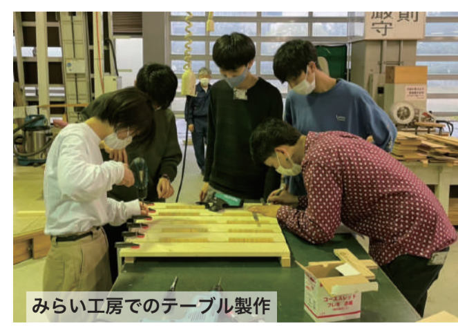
みらい工房でのテーブル製作

4月29日から5月5日までの7日間で1回目の社会実験を行った。この社会実験の目的としては、岩屋堂の現状把握、居心地の良い空間にするにはどのようにすればいいか、自分たちのSNSなどの宣伝でどれだけ人が来るのかなどを知るために来客者にアンケートを用いて検証した。岩屋堂は登山者、バードウォッチング者などが年間を通して多く、夏には川遊び、秋には紅葉祭りなどで賑わう自然豊かな場所である。登山者などの人が岩屋堂をゆっくりできる休憩所として利用してもらえるように、テーブルやイスなどを校内にあるみらい工房で作った。